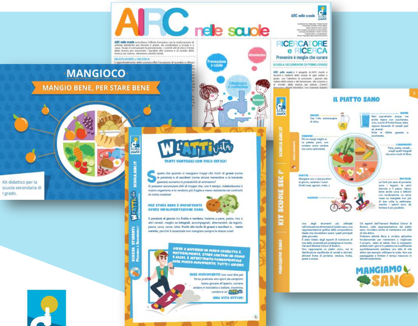
Kit didattico per la scuola secondaria di I grado.

Tanti percorsi e materiali didattici per coinvolgere la classe in letture, quiz, laboratori e giochi alla scoperta delle abitudini salutari e delle STE(A)M. Tutti i kit sono completi di guida docente.